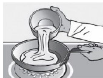
Zapečená pánev s přirozenými nepřilnavými vlastnostmi